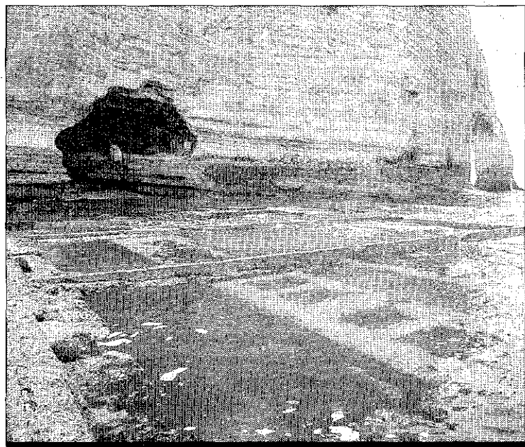
Le Trou-à-l'homme, à Etretat : un site très prisé des touristes et promeneurs, mais dont l'accès comporte des risques

FAITS DIVERS. Ils se sont retrouvés piégés par la mer, hier à Etretat.